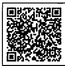
▲申込みフォーム 二次元コード